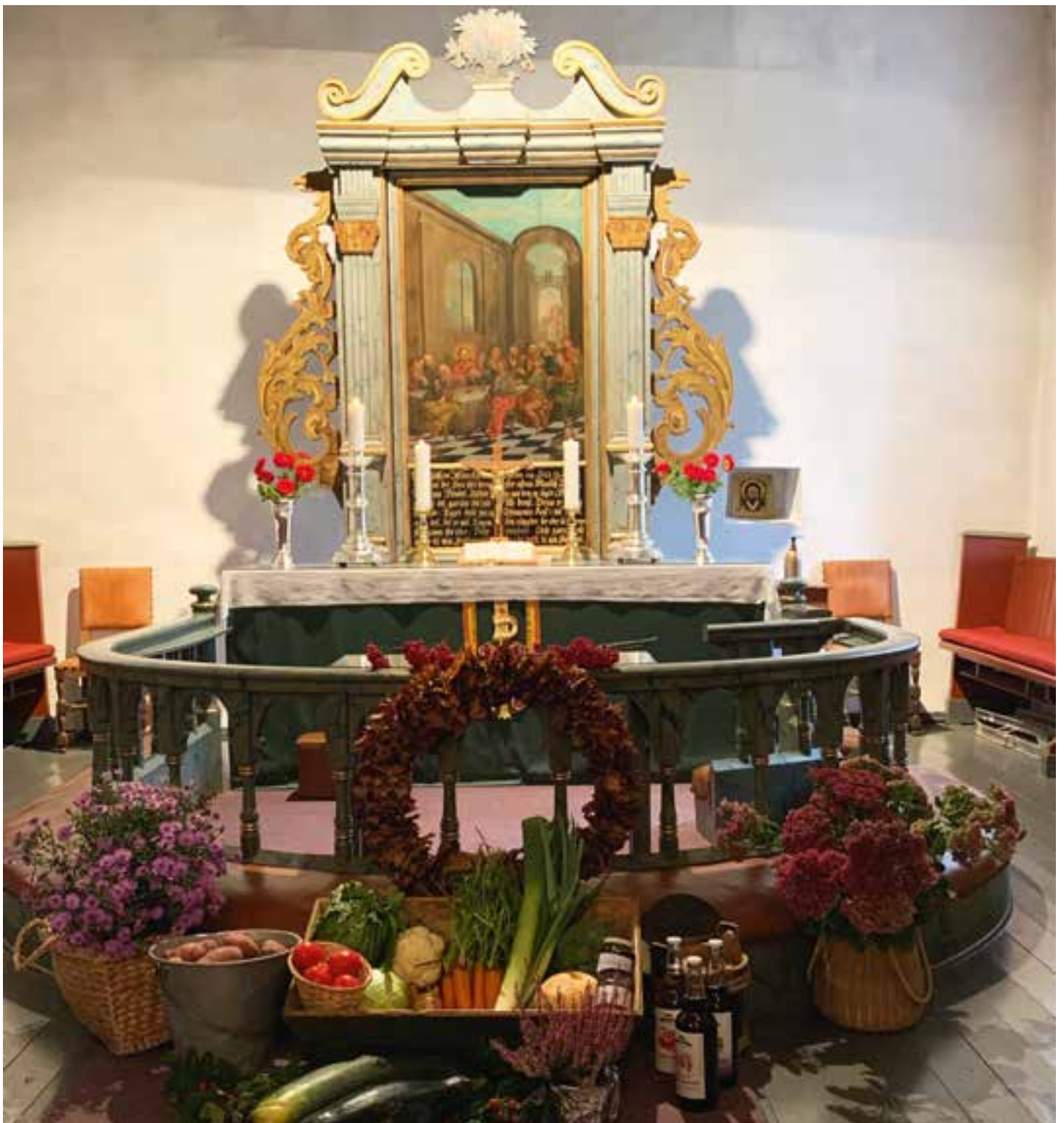
Bygdekvinnelaget har pyntet kirken til høsttakkefest.