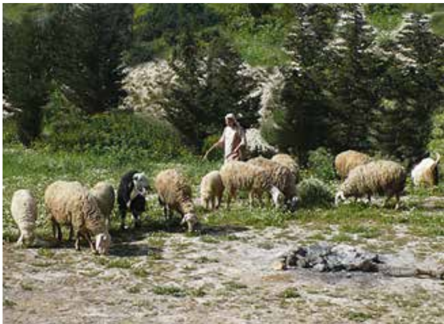
Fra ”Nazaret Village”, Israel.

Hva vet vi om disse folkene? Gjeterne hadde en vanskelig jobb i et krevende landskap. De skulle holde dyreflokkene utenfor dyrket og bebodd område, og samtidig vokte dem mot løver, ulv og hyener fra villmarka. De skulle føre dyrene til beiteområder i randsonen mellom dyrket mark og ørkenen, og de var selv i fare for angrep fra villdyr.